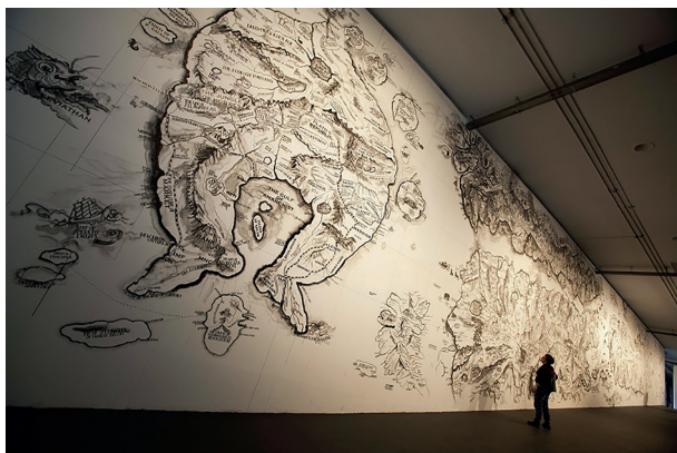
Figura 1: Vista de Mapa , del artista Qiu Zhijie, en la apertura de la 31ª Bienal de Arte de Sao Paulo.

vista como una herramienta para ir más allá de nuestra situación actual y para transformarla. En su mejor momento, el arte es una fuerza disruptiva, y en la medida en que permite diferentes maneras de imaginar el mundo, crea situaciones en que lo rechazado puede ser aceptado y apreciado. A su vez, la transformación entonces se puede entender como una manera de lograr un cambio en el rendimiento de la transgresión, la transmutación, el transgénero, el tránsito, la transexualidad, el transporte, la transmisión, el trastorno, entre otros 7 . Estas palabras ofrecen caminos para acercarse a esas “cosas que no existen”, o que no pueden existir bajo miradas convergentes y hegemónicas.