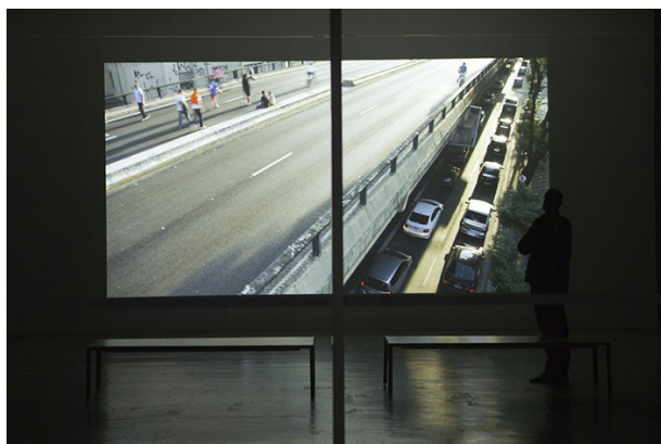
Figura 5: Invention , del artista Mark Lewis. Fuente: Invention , del artista Mark Lewis

Esta es una instalación a gran escala que se basa en una suposición ficticia y simple, pero muy sugerente: la existencia de un mundo paralelo (que no existe), gracias a las tecnologías de la imagen en movimiento. El proyecto nos lleva a especular sobre cómo habríamos mirado las imágenes si no existieran el cine, la televisión y otras plataformas en línea. Nos preguntamos entonces ¿puede una imagen-movimiento devenir en un CsO?