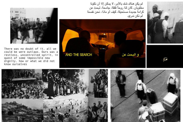
Figura 9: The Incidental Insurgents , de los artistas Basel Abbas y Ruanne Abou-Rahme.

Abou-Rahme. A través de textos, objetos, performances, sonidos y videos, artistas palestinos proponen entornos de inmersión y creaciones multimediales. Abren forados en los estratos de múltiples historias: sus obsesiones, las nuestras, las del mundo asiático y las que “no existen”.