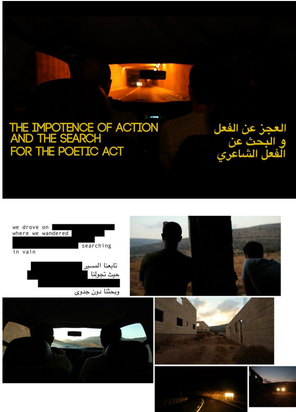
Figuras 10 y 11: The Incidental Insurgents , de los artistas Basel Abbas y Ruanne Abou-Rahme.