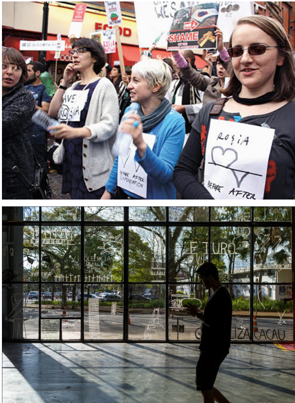
Figuras 2 y 3: Vistas de la obra Wall work workshop , del artista Dan Perjovschi.

Tórax - corazón. Trans Américas del artista chileno Juan Downey (1940-1993) es el articulador de la muestra. El trabajo de Downey instala la posibilidad y el sentido de los tránsitos dentro de la exposición. El artista realizó muchos viajes por América Latina en busca de una arquitectura invisible. Buscó el sentido del viaje ritual, las espirales, el reencuentro o desencuentro entre personas y entre culturas, el más allá de las migraciones y las buenas o malas experiencias de no ser de aquí ni de allá; todo esto se convirtió en la reflexión visual y audiovisual de la jornada misma. ¿Desterritorialización de un organismo geopolítico, de esa región