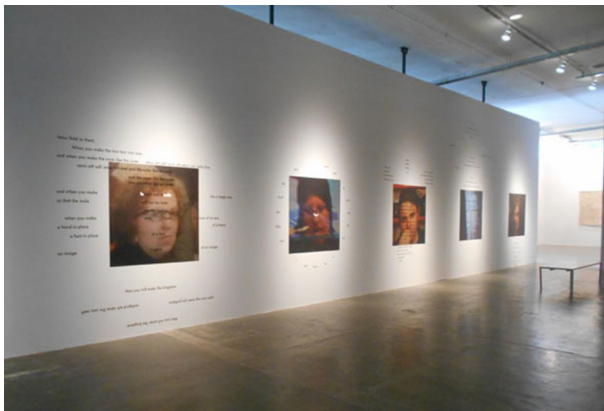
Figura 6: Panorámica de la obra Worlds That Are on This One del artista Tony Chakar.

En este marco nos preguntamos: ¿puede la curatoría de la 31ª Bienal cumplir su promesa denunciante y liberadora? ¿Se desterritorializa en pos de esa “nueva tierra”? ¿Es posible esa “nueva tierra” de estratos abiertos?