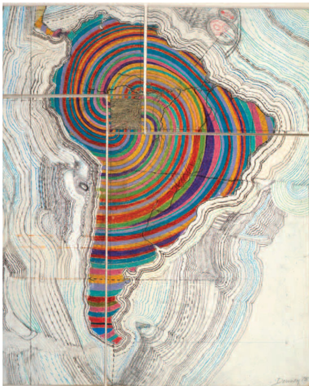
Figura 4: Mapa de América , del artista Juan Downey