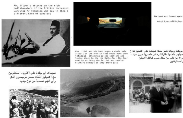
Figura 8: The Incidental Insurgents , de los artistas Basel Abbas y Ruanne Abou-Rahme.

En esta línea podemos aprehender la operación de Chakar que no suprime los rostros, sino que los anula en tanto organismo, haciendo que sus movimientos intensivos “[...] tracen líneas de fuga, justo lo suficiente para abrir en el espacio una dimensión de otro orden favorable a estas composiciones de afectos.” Es decir, el afecto no culmina en el “borramiento de los rostros en la nada”, sino desviarlo hacia lo abierto, “hacia lo vivo” (DELEUZE, 1984, p. 150).