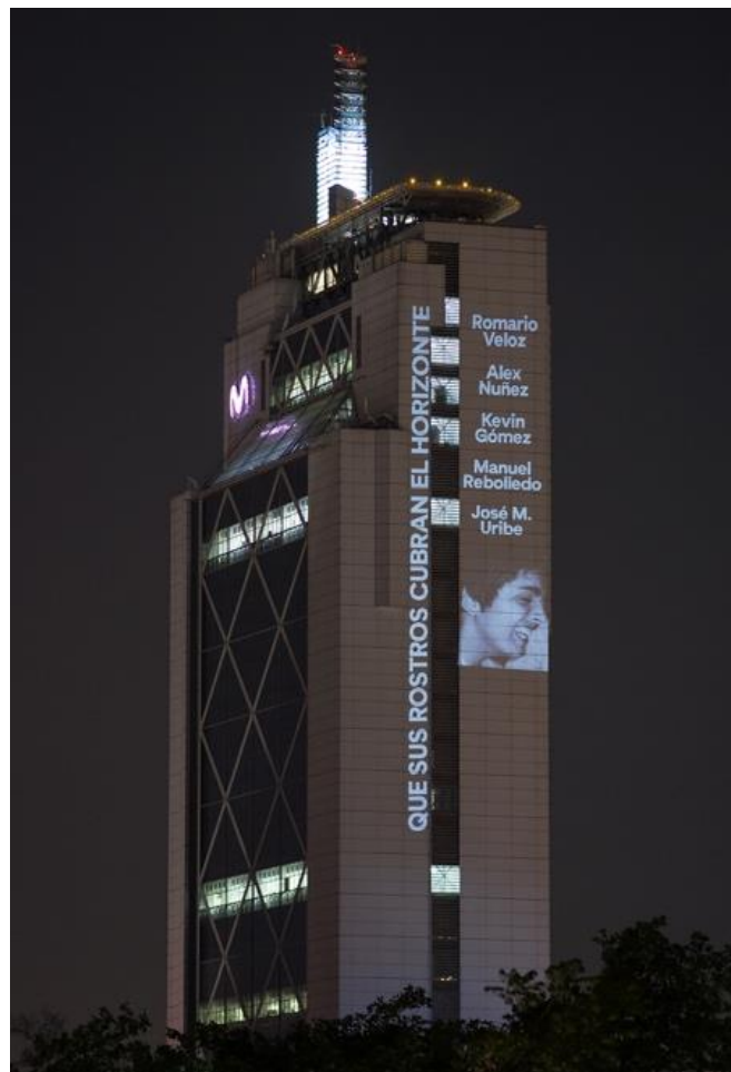
Delight Lab y Raúl Zúrita, Que sus rostros cubran el horizonte . Santiago de Chile, 2019-20.

estéticas no se limita al ámbito de la experiencia estética, sino que lo trasciende, incidiendo sobre las dinámicas del poder en diversos ámbitos del campo social. Esto es posible porque, como sostienen prácticamente todas las teorías contemporáneas del afecto, este tiene un vínculo fundamental con la agencia (p. ej., Gregg y Seigworth, 2010). El afecto no solo está en el centro de cuestiones como el conformismo, la aceptación pasiva del estatus quo, la discriminación de quienes no se alinean con el modelo social hegemónico y los neo-fascismos contemporáneos. También es el motor de los agenciamientos políticos y los esfuerzos por interrumpir la circulación del poder y la lógica del sistema. Así, el término intervención estética se refiere a aquellas prácticas que buscan, desde la experiencia estética que constituyen o posibilitan, resistir, subvertir, deconstruir y/o transformar las dinámicas del poder, tanto aquellas que atraviesan el ámbito de lo estético como aquellas centradas en otros ámbitos de lo político y social.