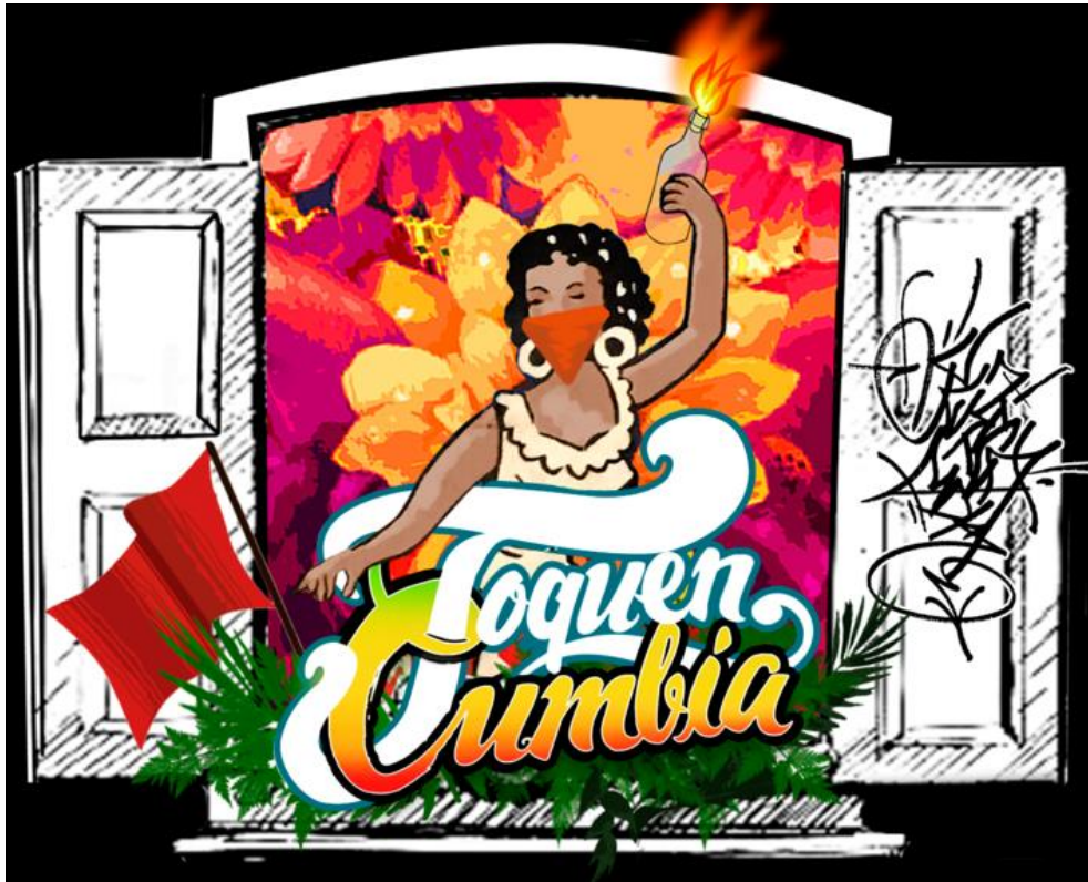
Streetdente, Toquen cumbia, 2020.