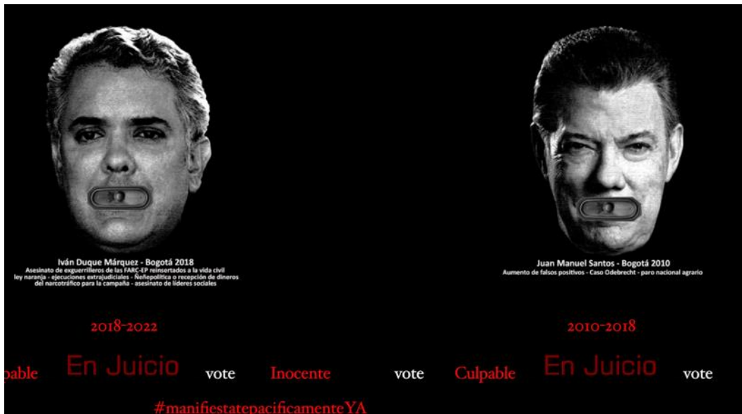
Fernando Pertuz, Los hijueputas (detalle), 2021.

obras constituyen un vector de difusión del sentimiento de inconformidad de una buena parte de la población civil hacia sus gobernantes y las instituciones de ejercicio del poder.