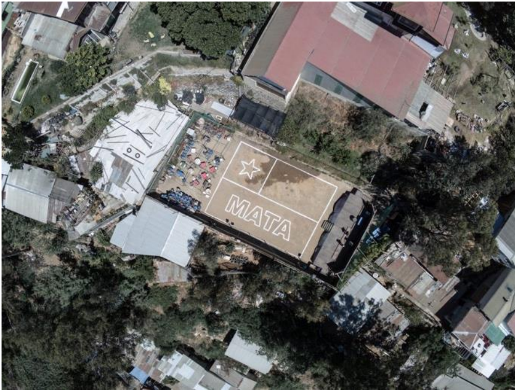
Pésimo Servicio, Chile mata . Valparaíso, 2019.

También en Valparaíso, el artista Danny Reveco ha realizado varias intervenciones en el contexto de la crisis en Chile. Reveco, quien siempre usa una máscara cuando está en público, es conocido en Valparaíso y Chile tanto por sus murales como por su obra artística multimedia. En el vídeo-performance Nadie ni nada está olvidadx (2021), vemos al artista recolectando alimentos no perecederos para luego llevarlos a algunos de los más de 2500 líderes sociales que fueron detenidos durante el Estallido Social. En otro vídeo-performance, Contagio (2021), presentado como un “challenge” a la manera de los retos que se han viralizado en plataformas como TikTok, Reveco se traga, pedazo a pedazo, una impresión fotográfica de un enmascarado presidente Piñero, en un acto de antropofagia simbólica. En la puesta visual Imagen higienista (2020), Reveco intervino digitalmente una fotografía de inicios del siglo XX que muestra al entonces intendente de Santiago, Benjamín Vicuña Mackenna, junto con otros oficiales del gobierno, parados en la colina Huelén, la cual Mackenna planeaba convertir en un parque de estilo parisino, que no solo sería un “pulmón verde” en el centro de la ciudad, sino que también serviría para separar a la élite capitalina de los