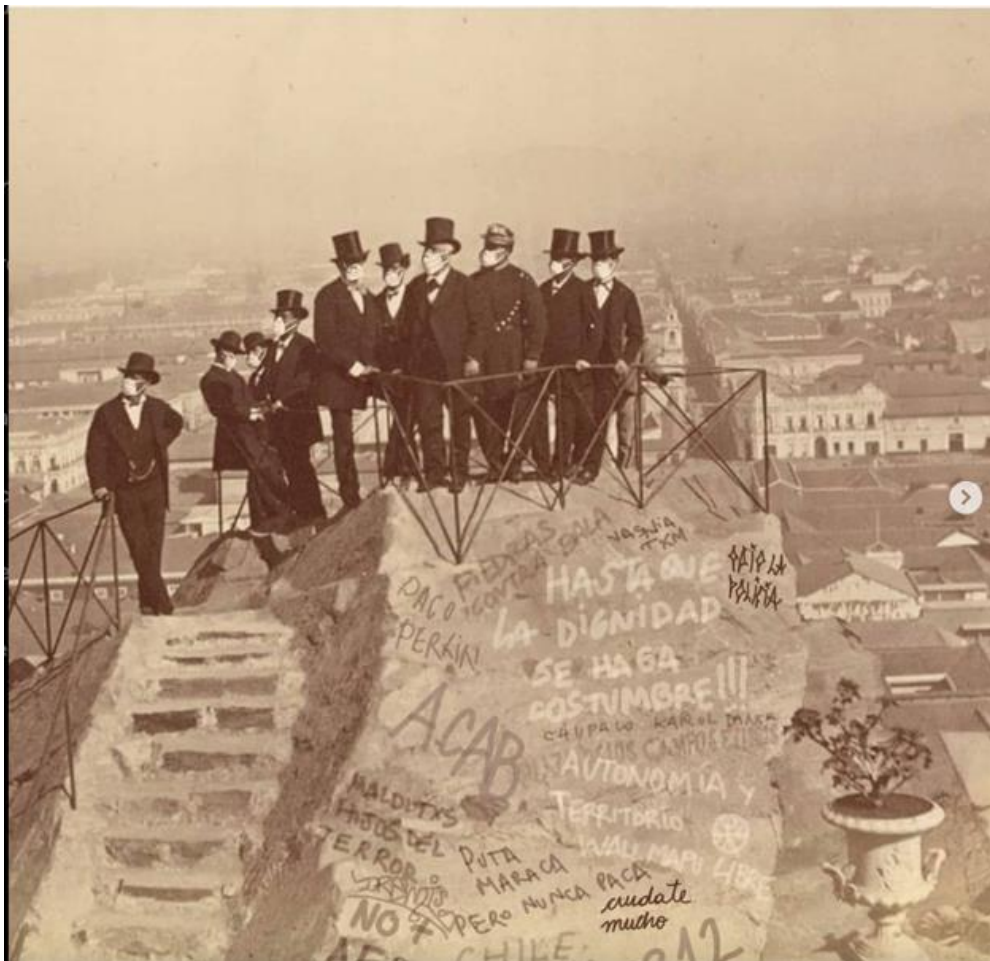
Danny Reveco, Imagen higienista , 2020. Cortesía del artista.

campesinos e indígenas que llegaban a la ciudad, a quienes el intendente tildaba públicamente de “sucios”. En la imagen, Reveco le colocó tapabocas a Mackenna y sus acompañantes, e intervino la cima de la colina con algunas de las frases y eslóganes usadas por los protestantes durante el Estallido Social, vinculando genealógicamente las discriminaciones y exclusiones del pasado con las del presente. La imagen circula en la cuenta Instagram del artista, en donde su audiencia ha sido considerable.