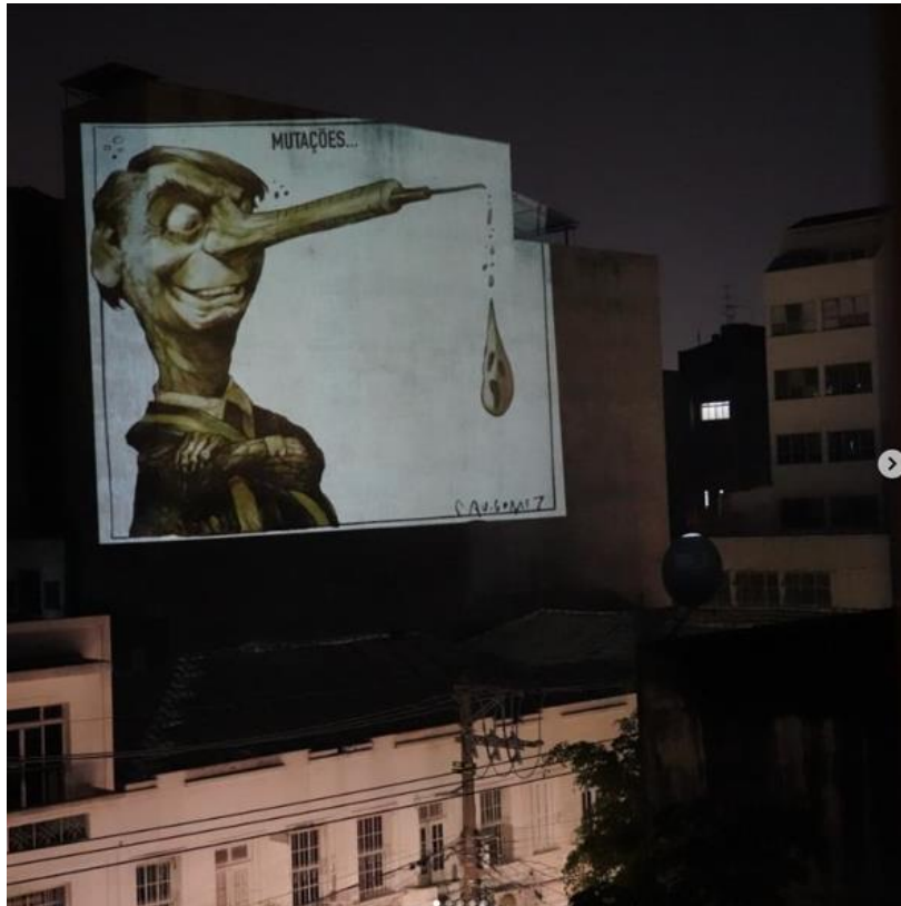
Projetemos, Mutações. São Paulo, 2021.